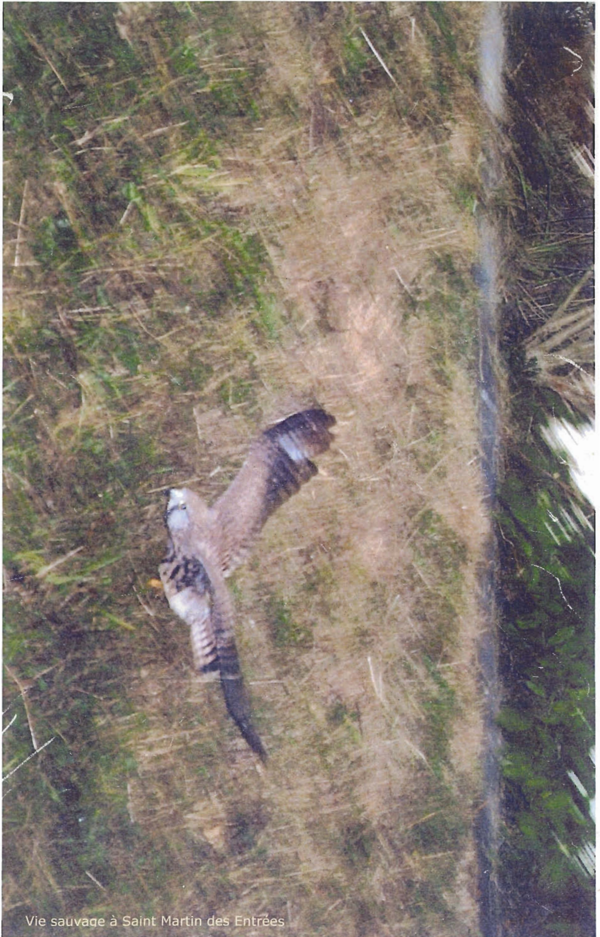
Vie sauvage à Saint Martin des Entrées