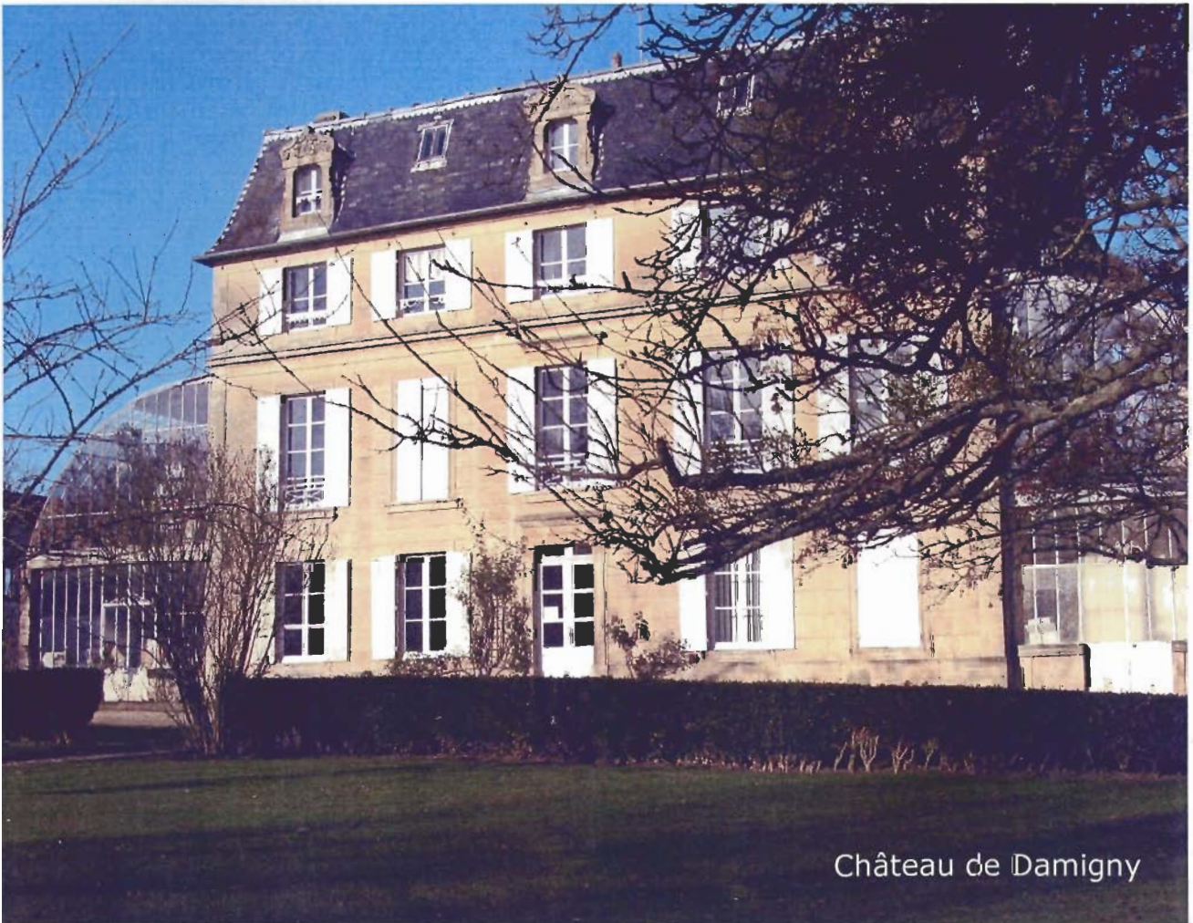
Château de Damigny