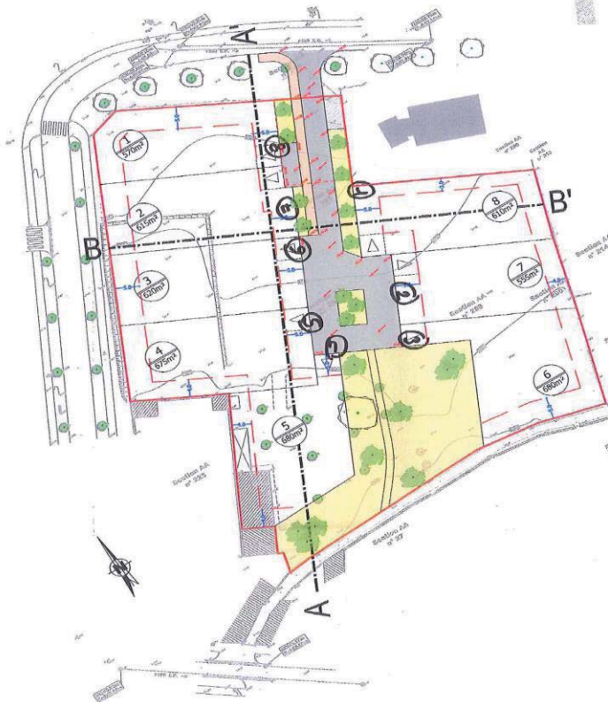
PLAN ANNEXE DCM 2016 05